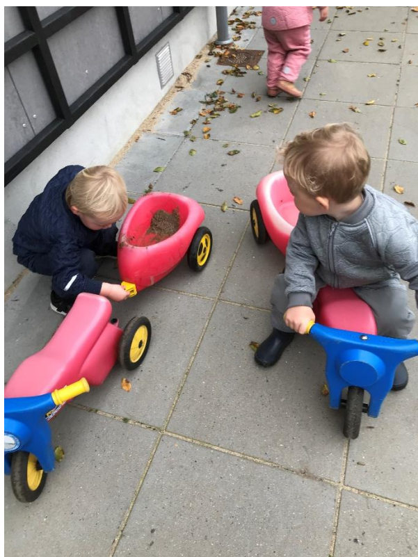
To gode venner kører scooter, og hjælper hinanden med at få løst udfordringerne.