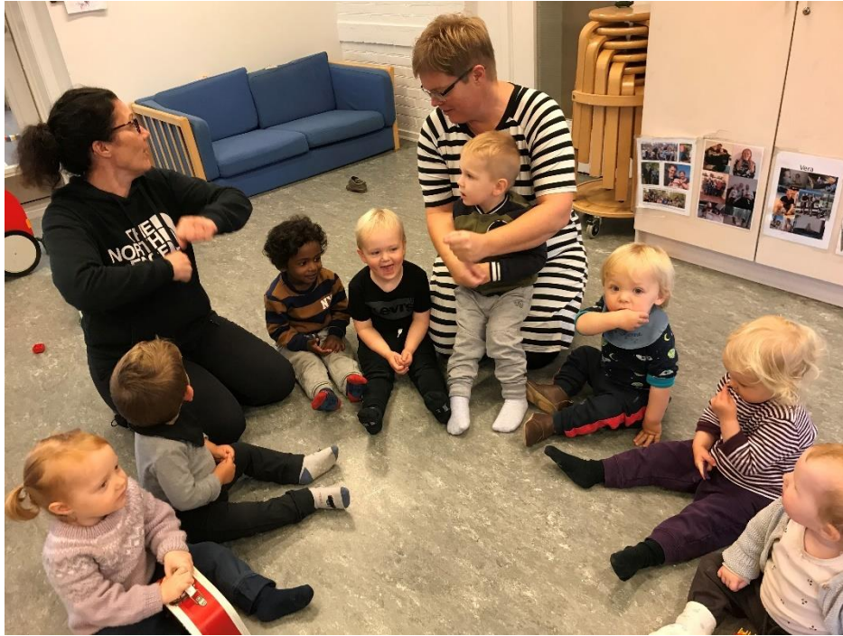
Vi holder samling, hvor der er fokus på sproglige kompetencer og fælles opmærksomhed.