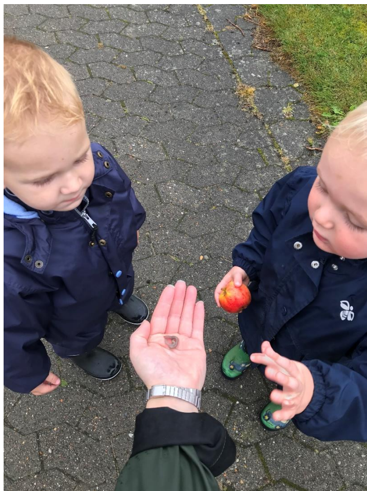
På tur, hvor vi finder æbler og kryb. Der kommer god dialog om det, og der skabes fællesskab blandt børn og voksne

og mange andre dyr der bor i skoven og i vores nærliggende natur er svær at få øje på, derfor bruger vi bøger, billeder på stuen og vores IPad til at vise børnene dyrene vi taler om. I vuggestuen er vi en begynder fase med brug af IPad, hvor børnene får indblik i den digitale verden, og lov til at tage billeder og videoer af det der lige nu optager dem på deres færd i naturen. Deres billeder og videoer bliver derefter lagt ind på børne IPad i Book Creator så børnene ud fra et børneperspektiv kan fortælle deres egne historier og oplevelser.