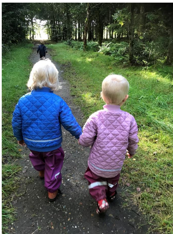
To venner på tur i skoven. Det skaber fællesskab.