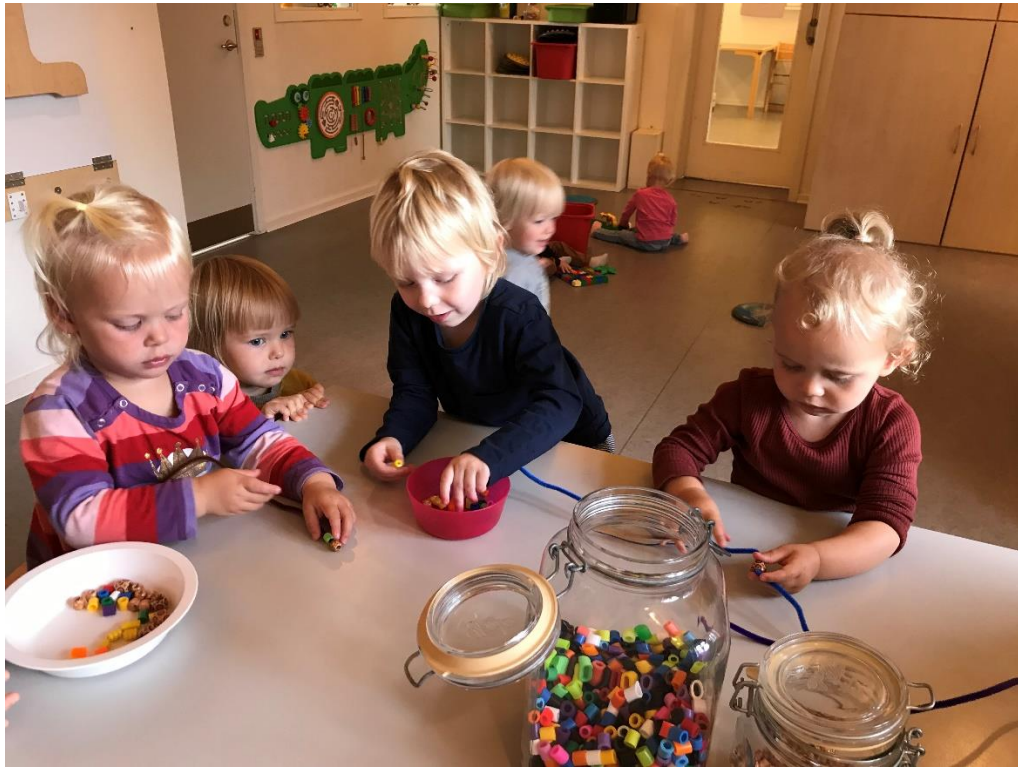
Det er tungen lige i munden, og kræver stor koordinering af øje og hånd at putte perler på piberensere.