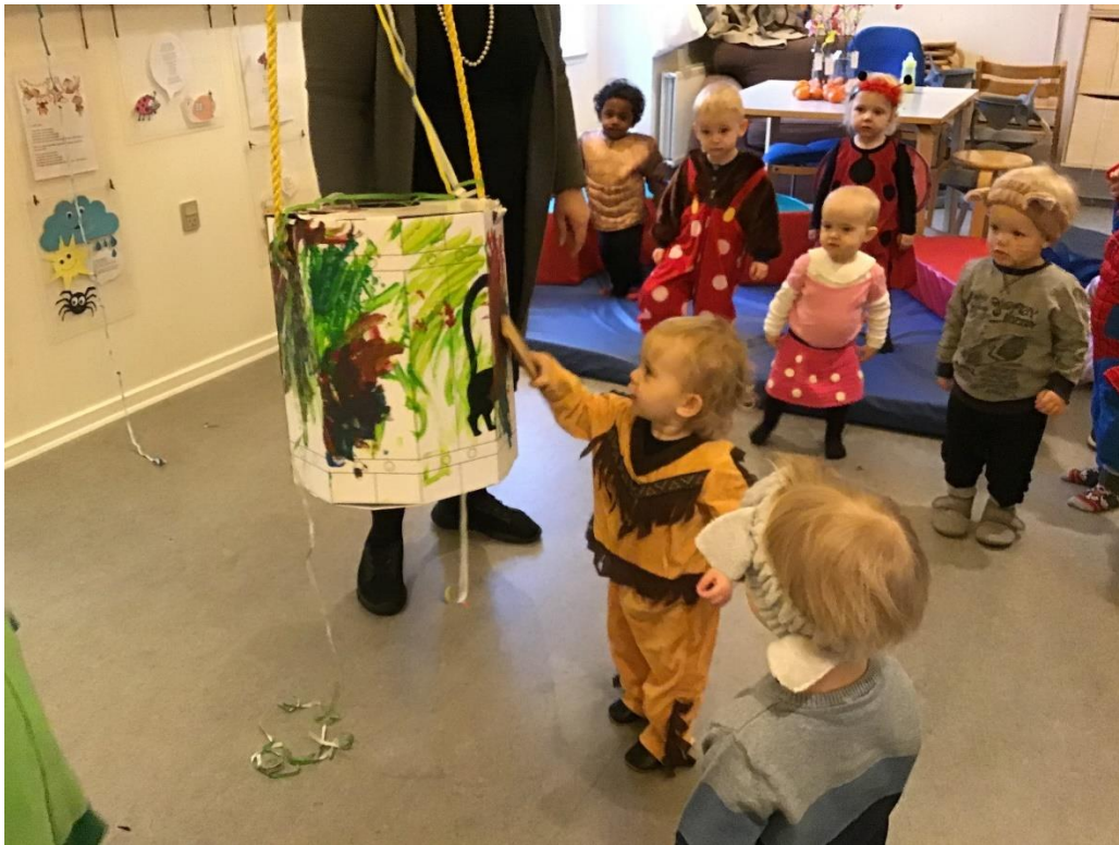
Fastelavn i vuggestuen, hvor vi slår katten af tønden og er klædt ud.