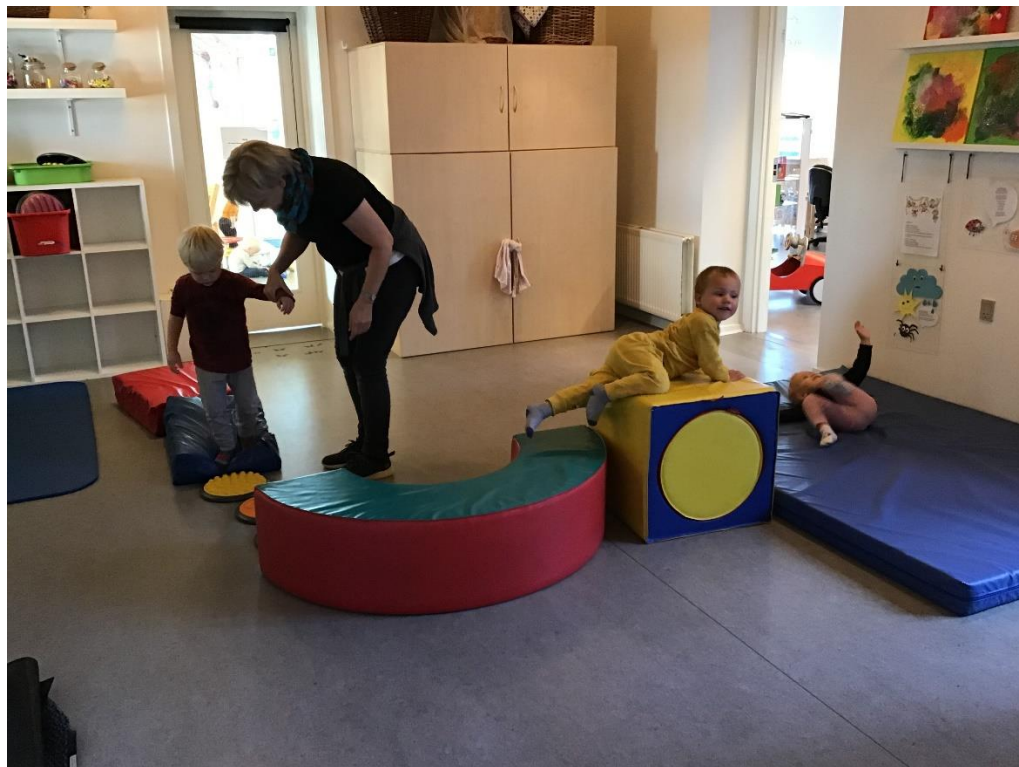
Motorikbane i vuggestuen. Det er spændende at udfordre sig selv, og dejligt at få hjælp af en voksen, når der er brug for en hånd til at komme videre.