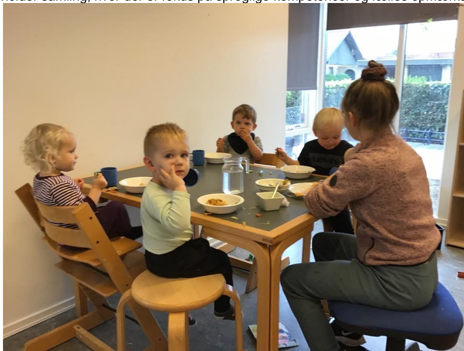
Vi er i dialog med hinanden til et måltid, hvor vi både får udvidet vores sproglige kompetencer og får øje på nye relationer i børnefællesskabet.