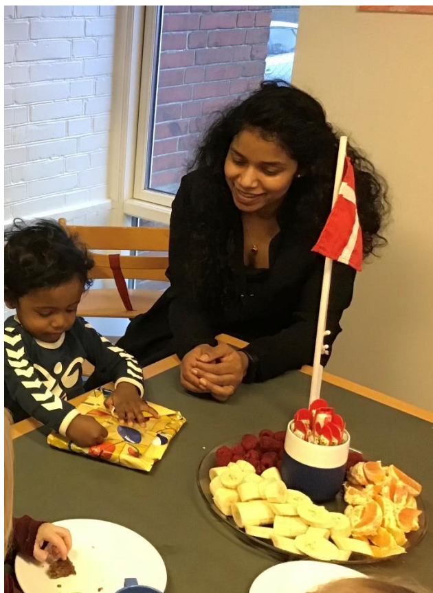
En dejlig fødselsdag, hvor der er flag, gaver og deltagelse af forældre.

Vi synliggør barnets kreative processer ved at udstillere det på stuerne, så børnene får ejerskab i rummets æstetik.