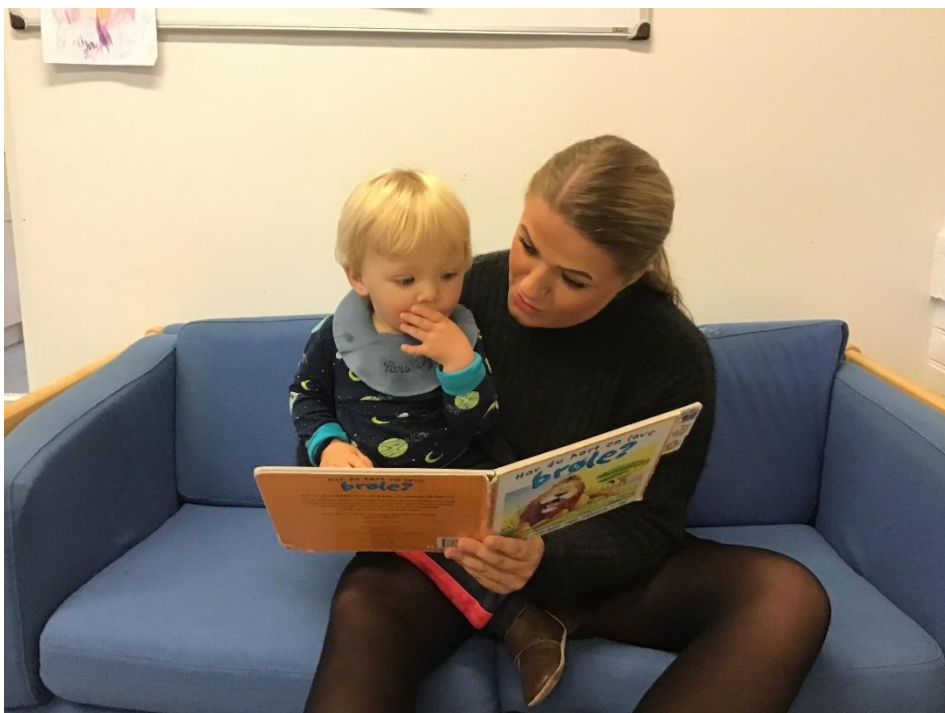
Dialogisk læsning, hvor der er fokus på kontakt, udveksling og sproglig udvikling.